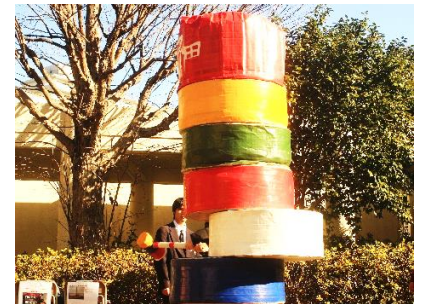
▲巨大だるま落とし