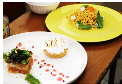
▲めんたいこを使ったパスタ