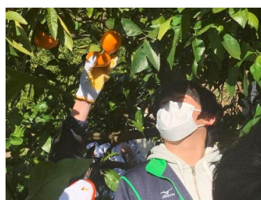
甘いみかんはどれかな？