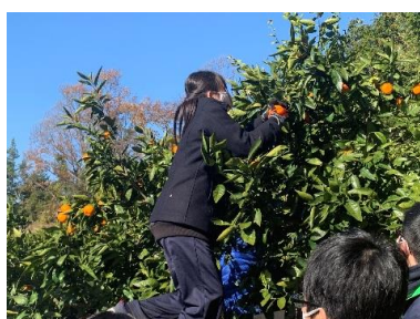
高い場所のみかんを狙う

12月18日(金)に1学年でみかん狩りが実施されました。今年はコロナの影響もあり、キャンプ実習同様、学年を午前・午後の2グループに分け実施しました。当日は朝から電車の遅延などもあり、登校が遅れる生徒もいましたが概ね予定通りの時間で進めることができました。星槎学園湘南校のみかん校舎に到着後、生徒もテキパキと行動し、例年以上にスムーズに行うことができました。学年全体で取り組む最後の行事として、有終の美を飾ることができました。これまでの行事への取り組みを、次年度以降の学校生活に活かせるよう職員一同サポートしていきたいと思っております。