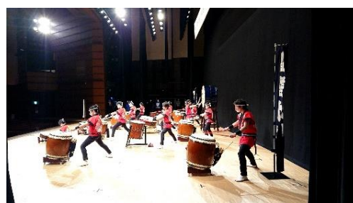
発表を行う和太鼓部