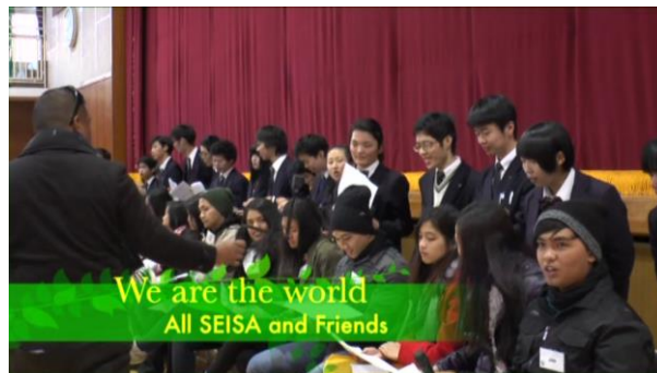
歌と一緒に歌う生徒達